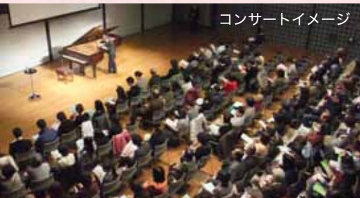
コンサートイメージ

上質な音色はホールにやさしく響きます。 ロシア・サンクトペテルブルクの名手、来日公演。