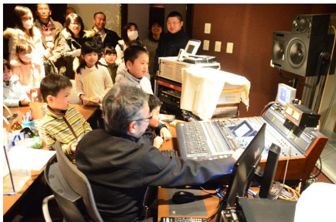
プロも使用！本格音響スタジオを見学！