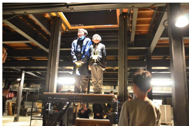
奈落の底からこんにちは！