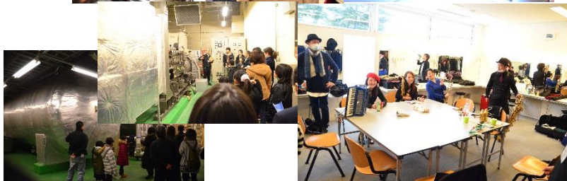
普段立ち入れない楽屋周りや地下の機械室にも潜入！