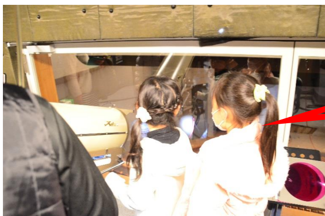
ピンスポットライトを操作！

次回開催日程は同時期を予定しています。さらに楽しんで頂ける内容を用意し、皆さまのご参加をお待ちしております。