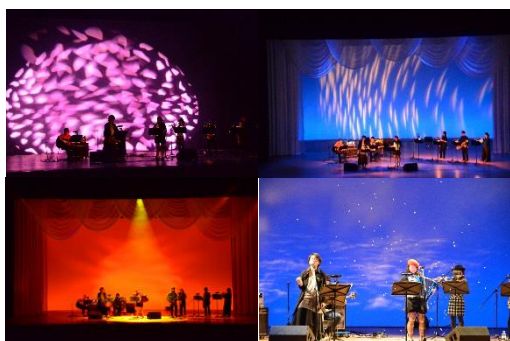
楽団のバックに舞台上で四季を表現！